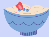
NATŪRALUS JOGURTAS SU ŠVIEŽIAIS VAISIAIS