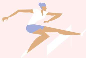
ŠOKINEJIMAS PER KLIŪTIS