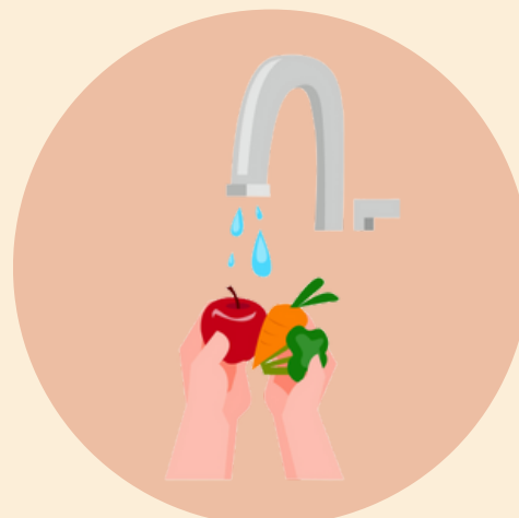
Nuplauti maisto produktus (parsineštus iš daržo ar parduotuvės)