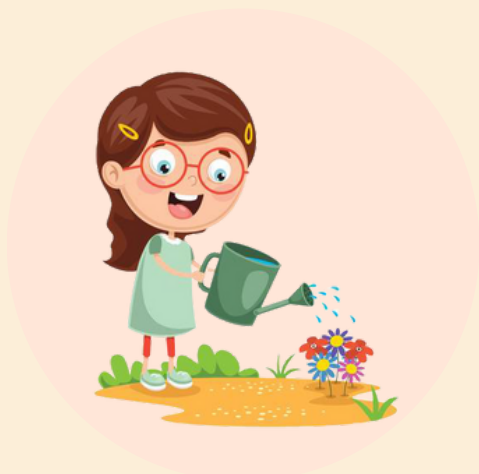
Palaistyti augalus, gėles, kad jie galėtų augti